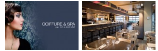
Coiffure & Spa par St-Laurent