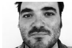
Qui a le droit?