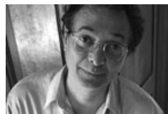
Arts et conservatisme: repérage de territoire