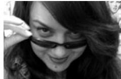
L'état du court