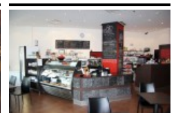
Café des Alizés