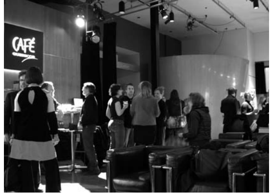
Lancement de l'étude Profil statistique de la saison théâtrale 2007-2008 Monument-National, 12 novembre 2010

G érant plusieurs dossiers de front, les membres du comité ont travaillé sur l'organisation des deux Rendez-vous du CQT tenus respectivement en décembre 2010 et en mars 2011 (lire le compte-rendu à la section Les Rendez-vous du CQT ), sur les modes de célébration de la Journée Mondiale du Théâtre (lire le compte-rendu à la section La Journée Mondiale du théâtre ) et sur l'orientation de l'étude concernant la promotion collective de l'art théâtral.