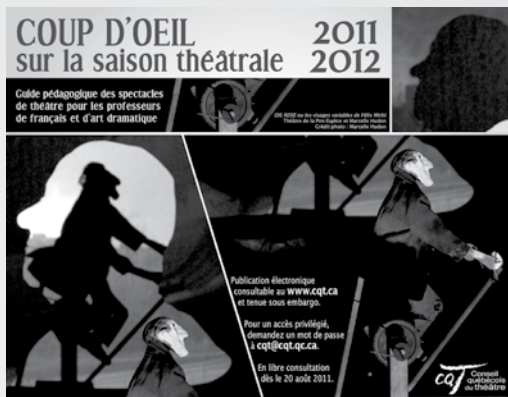
Photo du spectacle DIE REISE ou les visages variables de Félix Mirbt Théâtre de la Pire Espèce et Marcelle Hudon

La publication électronique Coup d'œil sur la saison théâtrale 2011-2012 , mise en ligne au mois de mai, propose pour cette 17 e édition 155 spectacles de théâtre présentés sur l'ensemble du Québec. Six festivals de théâtre y annoncent leur programmation et réservent un accueil particulier aux groupes scolaires. Rappelons que cette publication électronique se présente sous la forme d'un catalogue de pièces de théâtre qui permet aux professeurs de français et d'art dramatique ainsi qu'aux responsables des sorties culturelles de choisir l'expérience théâtrale la mieux adaptée pour leurs étudiants en fonction des thématiques étudiées en classe.