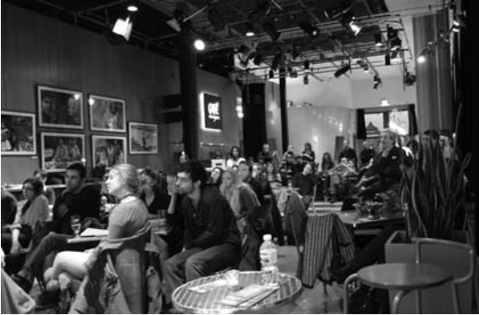
Rendez-vous du CQT - Monument-National, 13 décembre 2010

Une nouvelle formule d'activités proposée par le comité Animation du milieu a été mise sur pied par le CQT : Les Rendez-Vous du CQT . L'objectif de ces rencontres informelles est de permettre aux praticiens du milieu de se rencontrer et d'échanger autour de sujets variés.