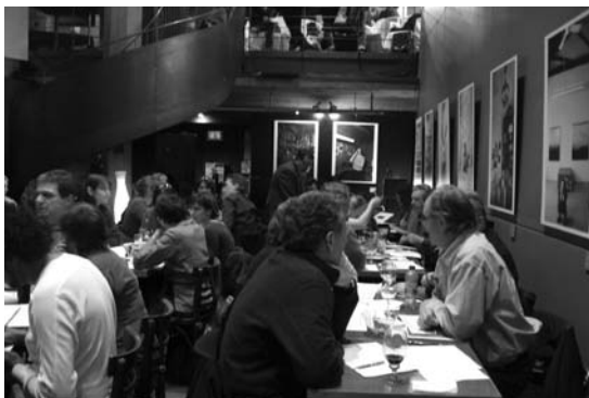
Rendez-vous du CQT - Usine C, 14 mars 2011

Afin de relayer la voix de son milieu, le CQT a déposé par la suite un mémoire au MCCCQ qui reprend en substance les questionnements et les préoccupations recueillies lors de cette rencontre. Dans ce mémoire, le CQT met l'accent sur la nécessité d'accorder une plus grande reconnaissance du rôle et de la fonction sociale exercés par les arts et les artistes au sein de la société québécoise. Cette reconnaissance est indispensable, car la cohérence et la pertinence de